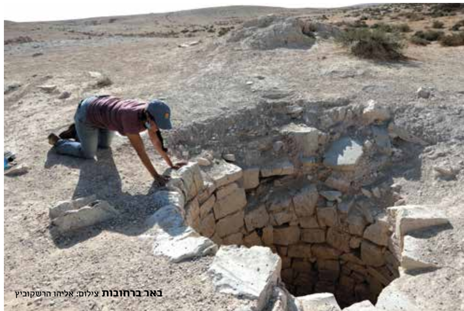
באר ברחובות

דומים ששימשו לייצור קטורת. מדוע מעטים מכירים את דרך הבשמים הישראלית? הפיתוח לא הצליח כי הוא נעצר מיד לאחר שהשלימו את הכשרת הדרך לנסיעת רכבי 4X4. אני מניח שרק 4,000 איש בשנה עשו זאת. הפוטנציאל אדיר וגדול פי כמה. כאתר אונסק"ו זה נתון מבין הסיבות חלקן פוליטיות (האינתיפאדה השנייה, צינור היחסים עם ירדן) וחלקן קשורות להעדר תשתית. הדרך שקעה בת רדמה. עד עכשיו לא קם לאורכה אפילו בית מלון אחד. אבל הגיע הזמן הנכון להעיר אותה. תיירות המדבר נהפכה בון-טון. משרד התיירות, בייחוד מאז מינויו של אמיר הלוי למנכ"ל המשרד, דוחף את 'המוצר הדרומי'. דרך הבשמים מככבת בתוכנית הוו כחיבור בין הערכה להרג. מה שצריך לפי תח עכשיו הם טיולי הליכה ורכיב בה על גמלים בקטעים מהדרך. ומה יקרה בחלוצה? היא אתגר גדול. אולי גדול מדי. ייתכן שהפ' תרון לאתר המדהים הזה הוא