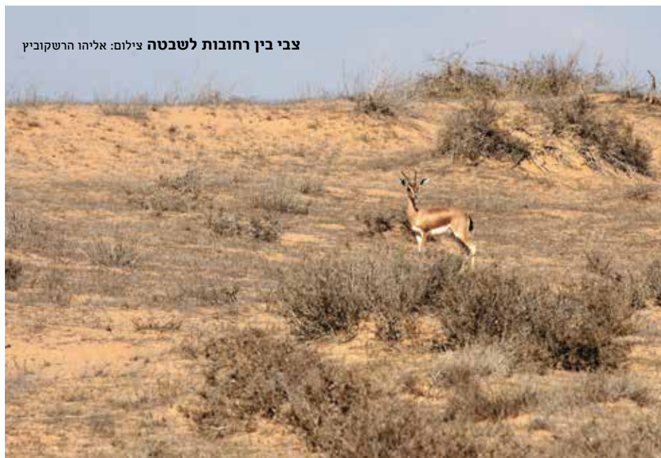
צבי בין רחובות לשבטה

על פי הסקירה – השרידים המרשימים ביותר של סיפור דרכי הבשמים מתבטאים בערים העתיקות עבדת, ממשיה, חלוצה, שב' טה, ניצנה ורחובות בנגב. אתרים אלה זכו על פי טמקין לחפירות, שיקום וסידור. לצידם נחפרו ושו' קמו גם אתרים משניים ובהם: מצ' דים ומצדיות, האנים לאירוה שיירות, שרידי מפעלי מים וחק' לאות ושרידי דרכים עתיקות.