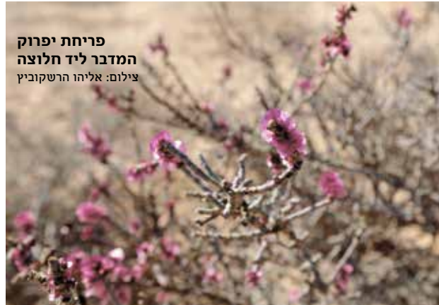
פריחת יפרוק המדבר ליד חלוצה

אני נזכר בכל הפעמים שבהן נסעתי שעות בדרכים פתלתלות כדי להגיע לאתרים שסופרי מסעות כינו "העיר האבודה". בחלוצה, עיר רק בשירות הצבאי לפני עשרות שנים