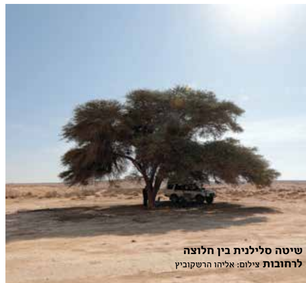
שיטה סלילנית בין חלוצה לרחובות

שיירות ענק של גמלים נשאו בדרך הבשמים, כ-1500 ק"מ, סחורות יקרות כמו ולבונה, מנסיכות עומאן ותימן עד נמל עזה ומשם לאירופה. פטרה שלאורך הנתיב הפכה למושכת תיירים