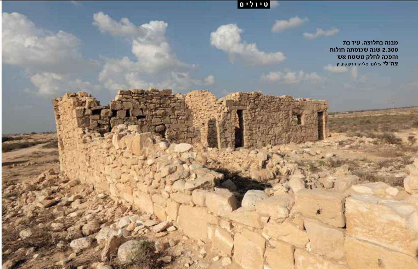
מבנה בחלוצה. עיר בת 2,300 שנה שכוסתה חולות והפכה לחלק משטח אש צה"לי